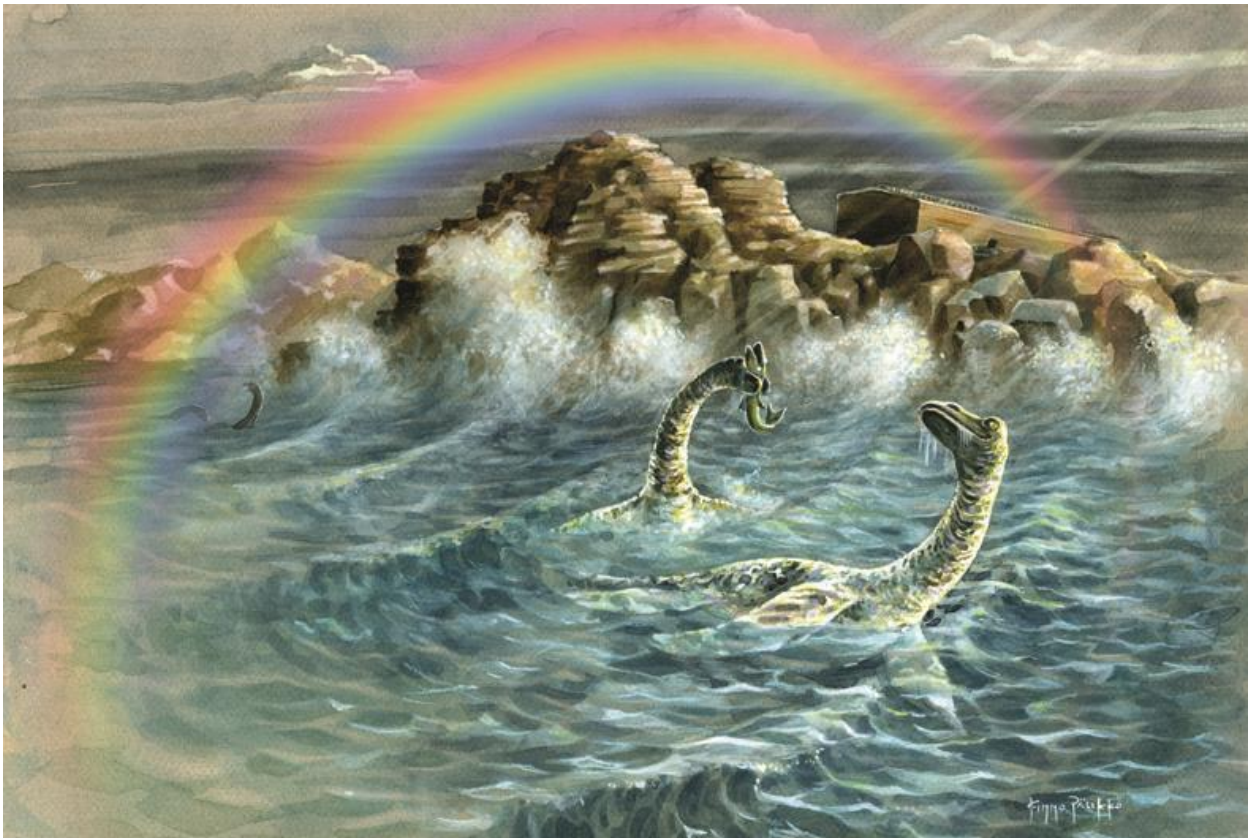
Kuva © taidegraafikko Kimmo Pälikkö

Luomisen ja vedenpaisumuksen jälkeen ei ole syntynyt enää uusia eläinlajeja vaan päinvastoin: monet eläinlajit ovat kuolleet sukupuuttoon, kuten dinosaurukset.