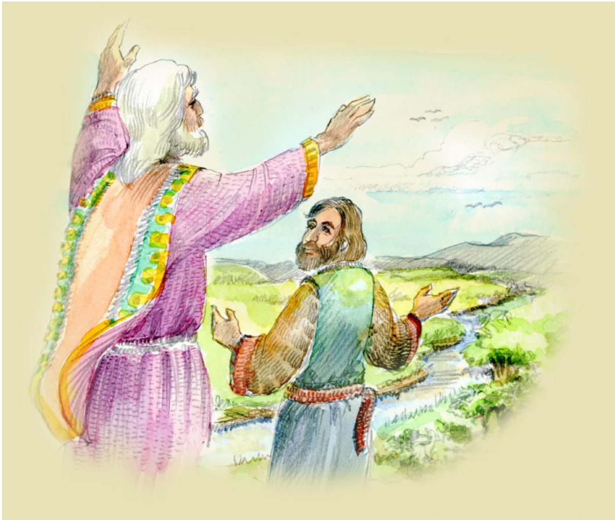
Kuva © taidegraafikko Kimmo Pälikkö