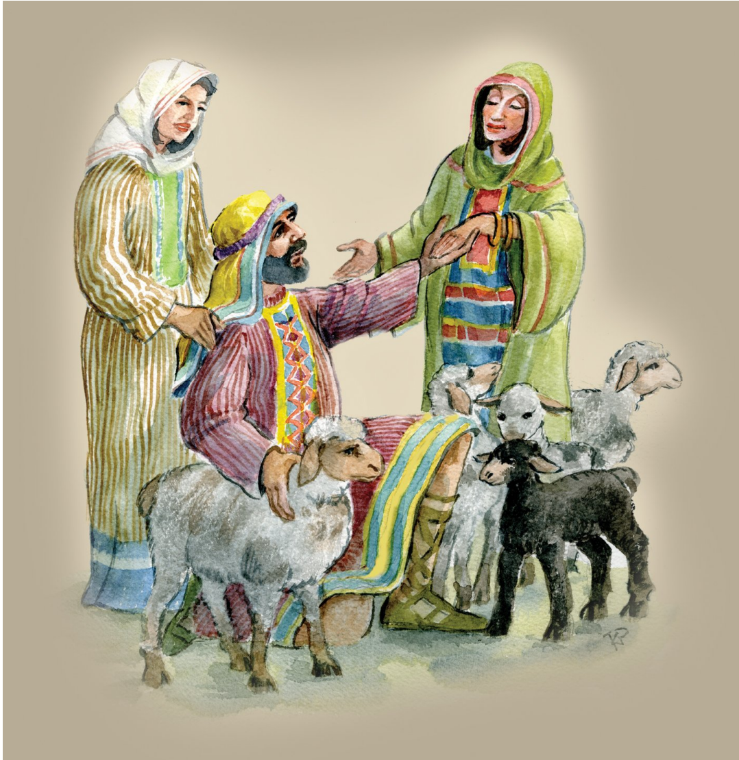
Kuva © taidegraafikko Kimmo Pälkkö