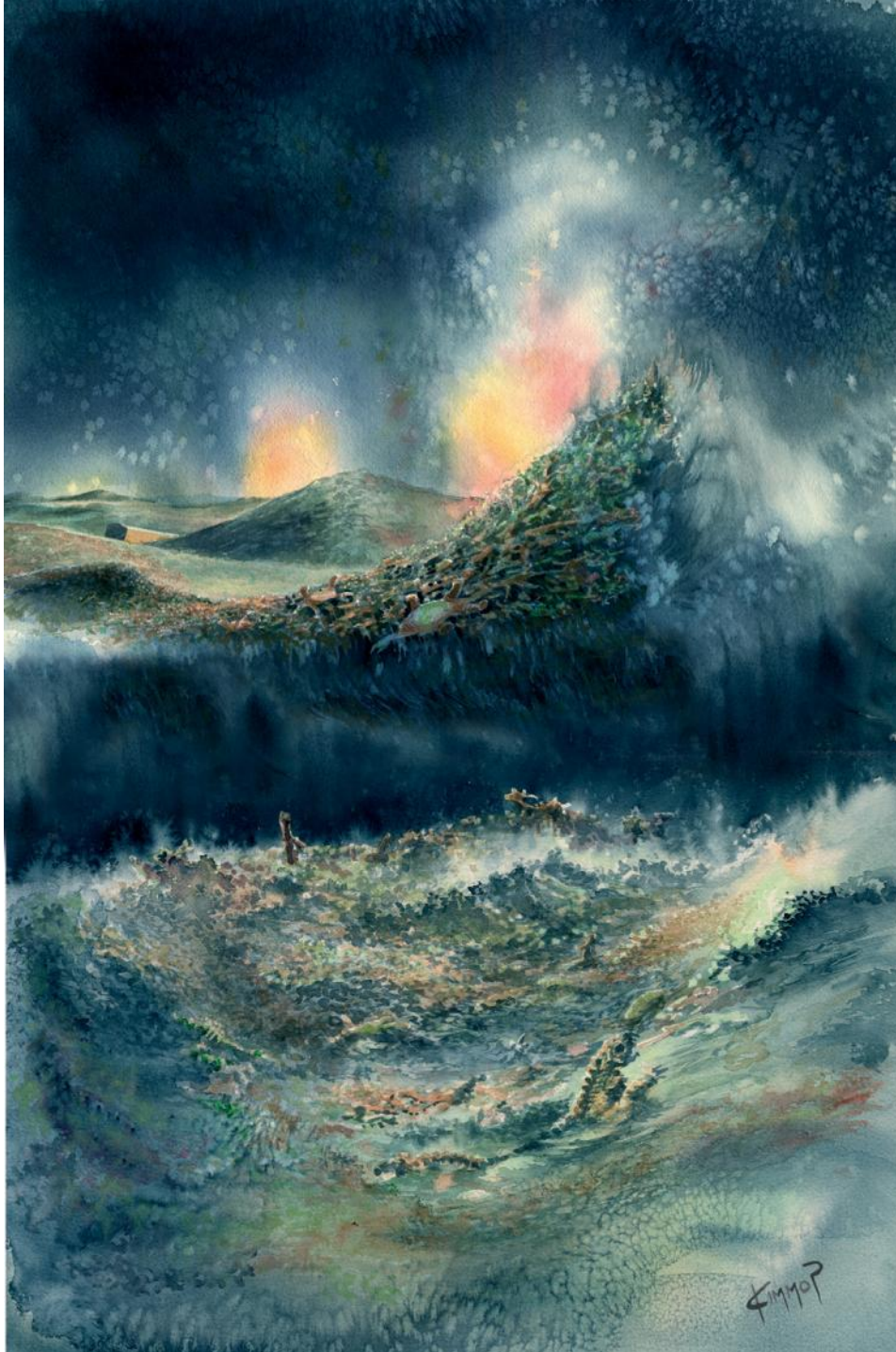
Kuva © taidegraafikko Kimmo Pälikkö